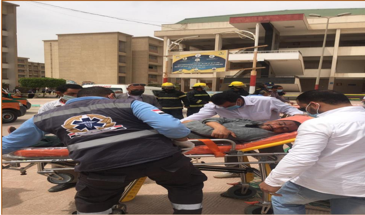
بعض من صور إجراءات خطة الإخلاء للعام الدراسي ٢٠١٥/٢٠١٦م